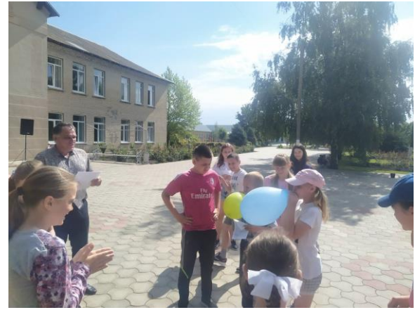
- Туристичний вогник