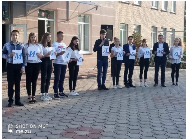
День Збройних сил України Всесвітній День гідності та свободи Посвята в Першокласники Свято «День Святого Миколая»