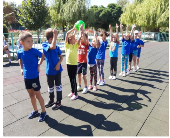
Свято День Учителя